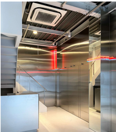
1階 入口から奥を見る