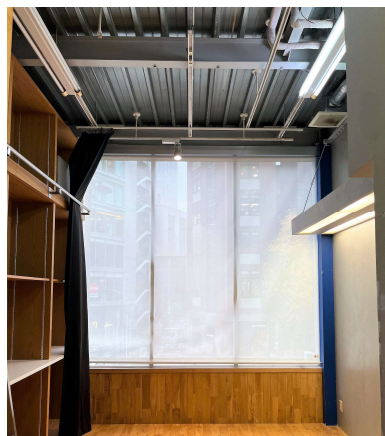
2階 奥から前方を見る