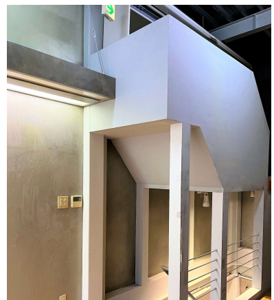
2階 左側収納ロフト